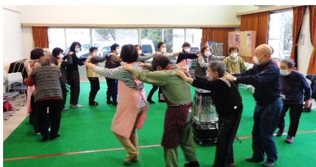
ジャンケンジェンカで参加者全員楽しみました。

お正月の間サロンはお休みしますが、 貯筋体操や753運動をつづけて下さい。 筋肉をつける日々の運動は、フレイル状 態にならない第一条件です。