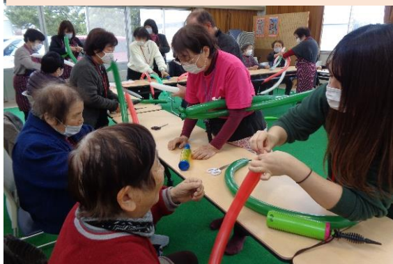
バルーンアートでクリスマスリース作り