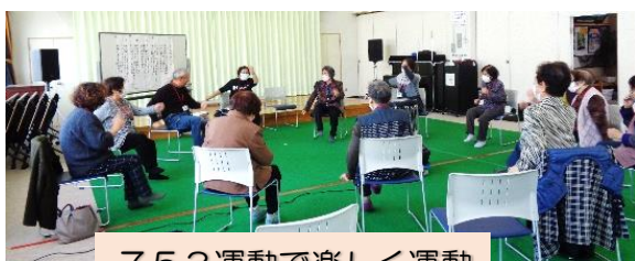
753運動で楽しく運動