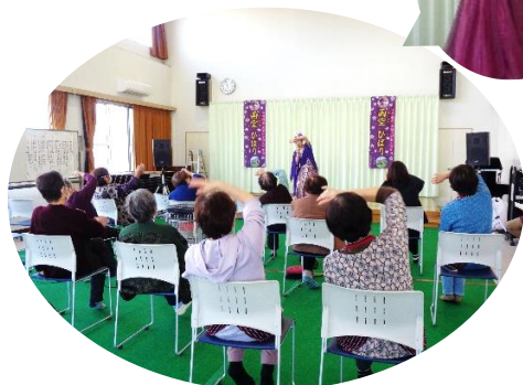
12/12 雨空ひばりショー