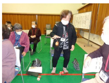
12/5 健康講座 回想法