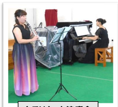
クラリネット演奏会