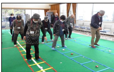
貯筋体操での取り組み