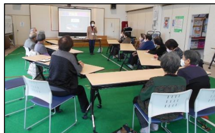
写真で見る回想法