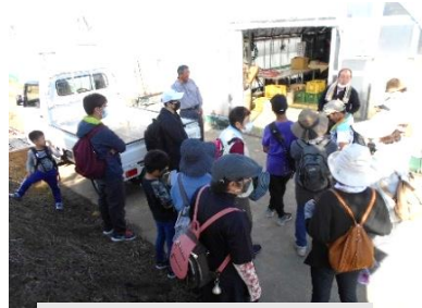
日の出屋 野菜ハウス