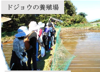
ドジョウの養殖場