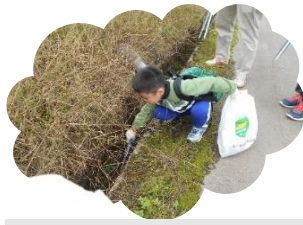
溝の中もしっかり確認