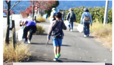
歩きながらのクリーン作戦

10月18日（日） 歩こう会をクリーン作戦を兼ねて実施しました。秋晴れのすがすがしい日となりクマよけの鈴とラジオ持参で無事コースを巡ることができました。