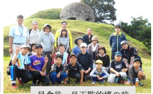
昼食後、目玉監的壕の前