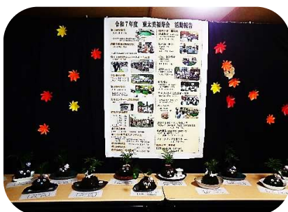
福寿会の作品と活動報告