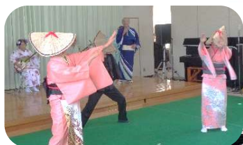
9/22 民謡歌謡ショー 福美会