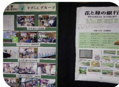
すずらんグループ(上野地区)と 花と緑の銀行の活動報告