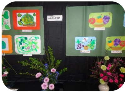
あおぞら保育園児の作品