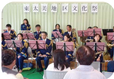
南砺市消防音楽隊演奏

「売店コーナー」では、農協青年部の屋台やボン菓子、地元の「干し芋」等の販売を行ないました。生菓子が早く売り切れになるなど、大盛況でした。