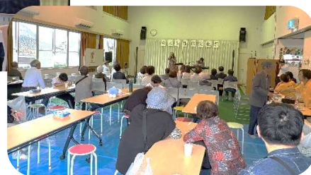
ステージに見入っている皆さん