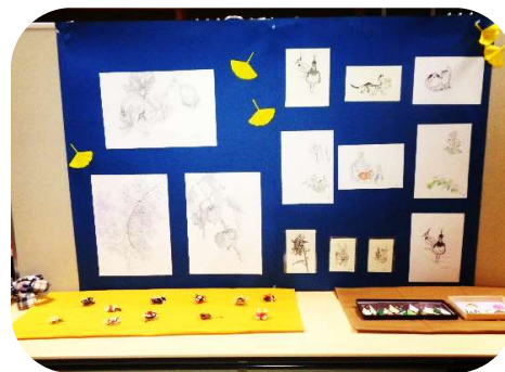
なごみごらく部 エコ・ECO教室の作品