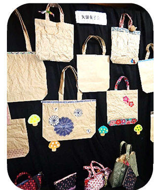
矢留女子会の作品