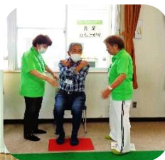
10/6 フレイルチェック