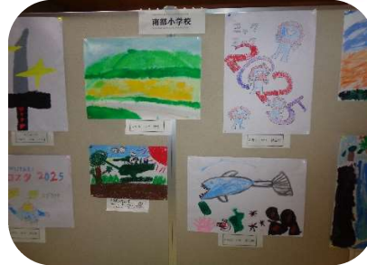
南部小学校児童の作品