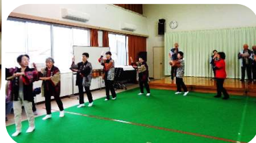
10/20 お楽しみアトラクション あじさいの会