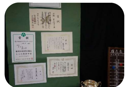
ペタンクの活動報告