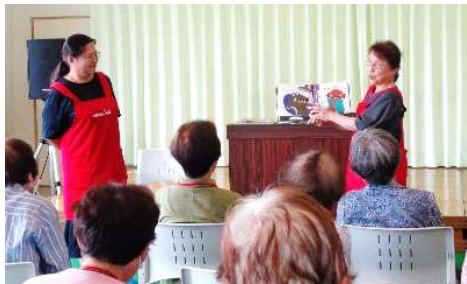
6月24日 「読み聞かせ」 読み聞かせサークル おはなしJA夢