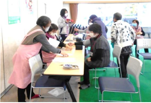
1月17日 ヘルスボランティアによる 血圧測定