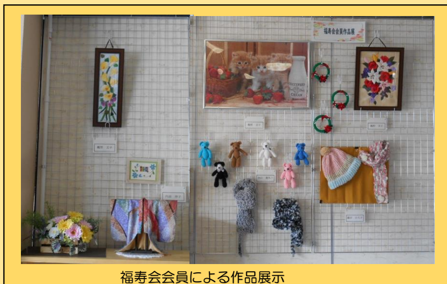
福寿会会員による作品展示